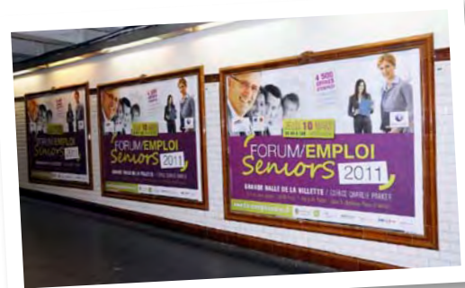
Affichage Métro 2011 : diffusion du 2 mars au 8 mars 2011

+ de 40 000 internautes ont visité www.forumemploiseniors.fr